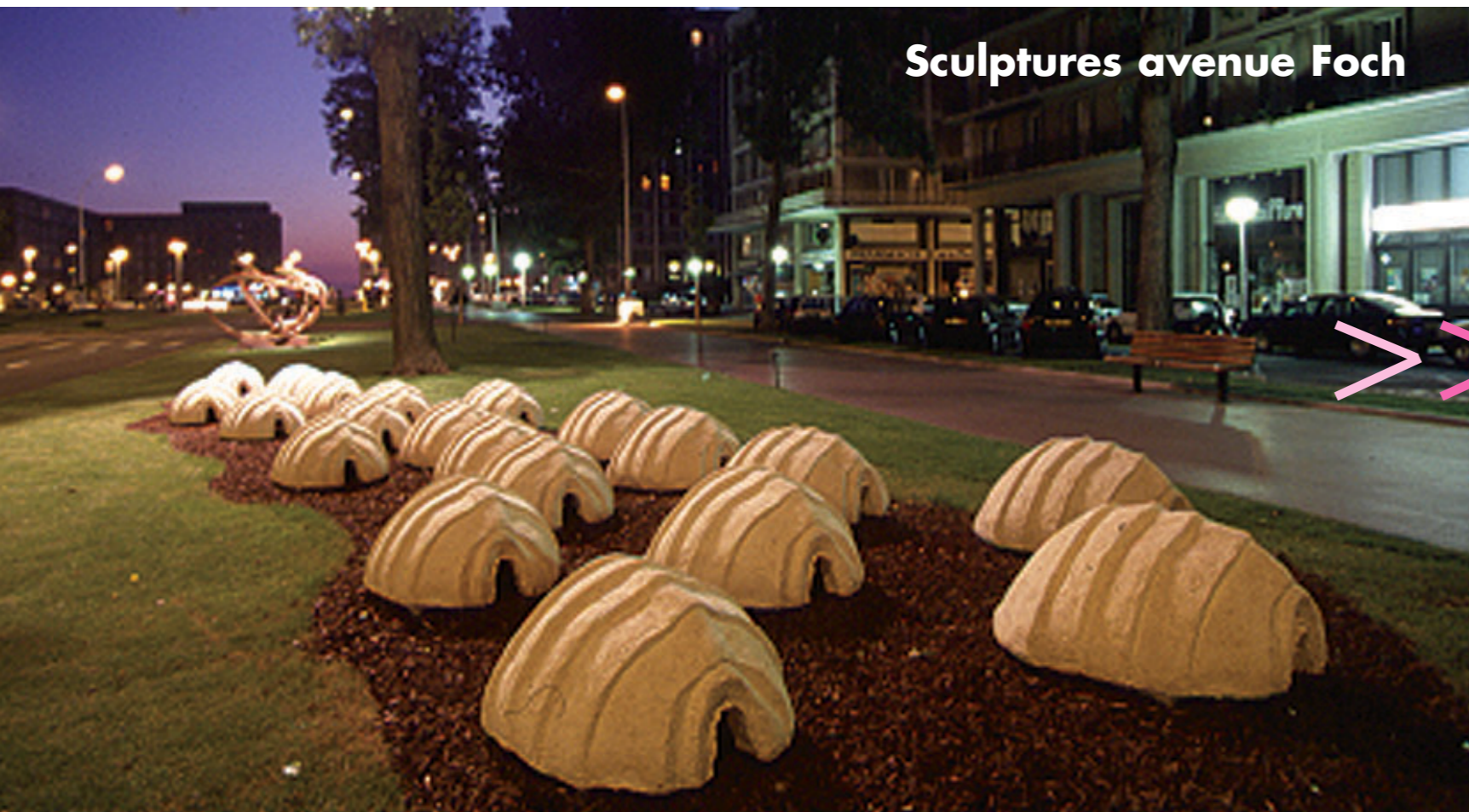
Sculptures avenue Foch

Une belle façon de lever les yeux sur l'architecture du Havre tout en s'amusant. Rendez-vous les samedi 16 et dimanche 17 novembre, à partir de 15 h. Renseignements au 02 35 19 62 62.